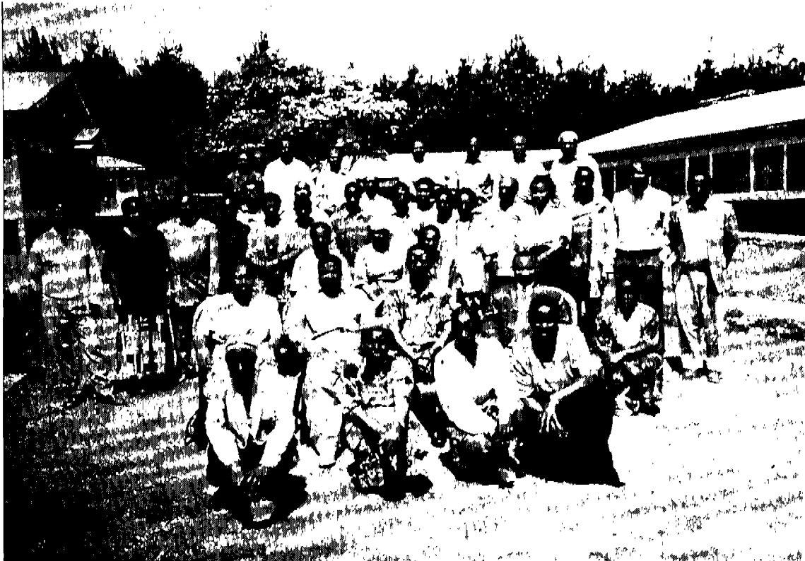
Picha ya pamoja inayoonesha washiriki wa Warsha ya Kuimarisha Uhusiano Baina ya Wakulima, Watafiti na Washauri wa Wakulima, Kanda ya Nyanda za Juu Kusini Iliyofanyika Katika Kituo cha Nazareti, Njombe 13 - 15 Novemba 2000.