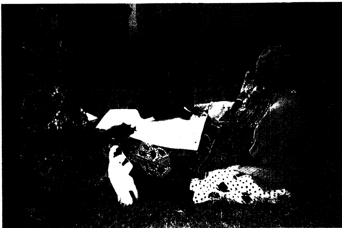
Kikundi cha wakulima wanawake wakiwa katika zoezi la kutambua visababishi vya matatizo ya masoko ya mazao