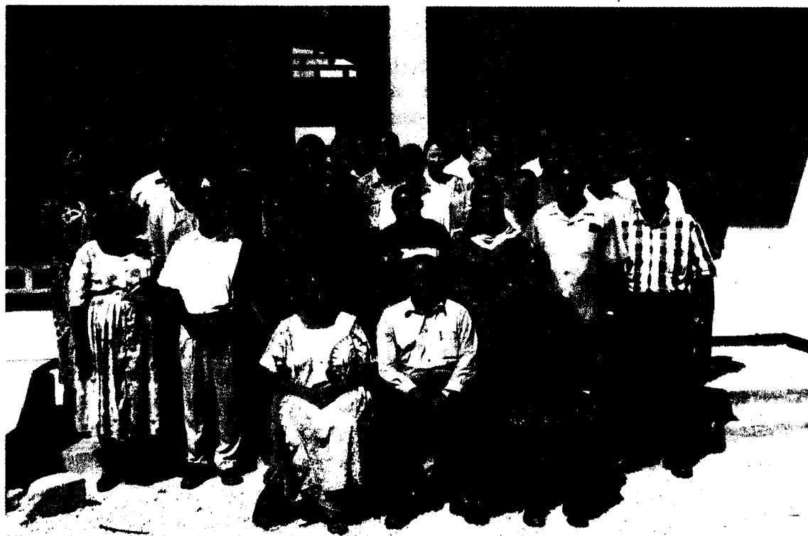
Washiriki wa Warsha wakiwa kwenye picha ya pamoja